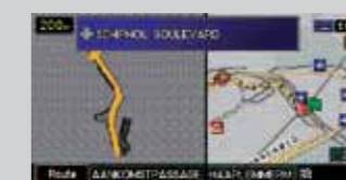
Najbliższy skręt / mapa