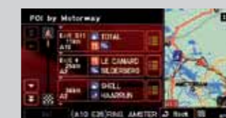
Interesujące punkty wzdłuż drogi