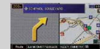
Lista skrętów / mapa