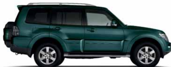
FAIRWAY GREEN (P)