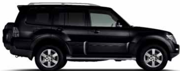
KNIGHT BLACK (P)