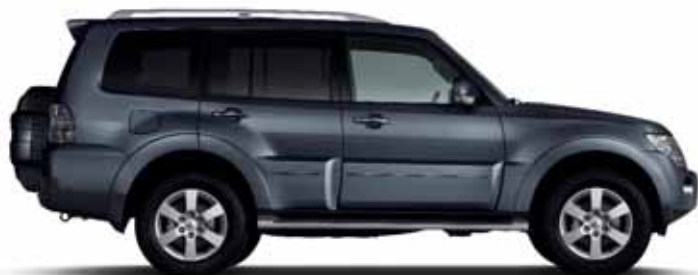
GRAPHITE GREY (P)