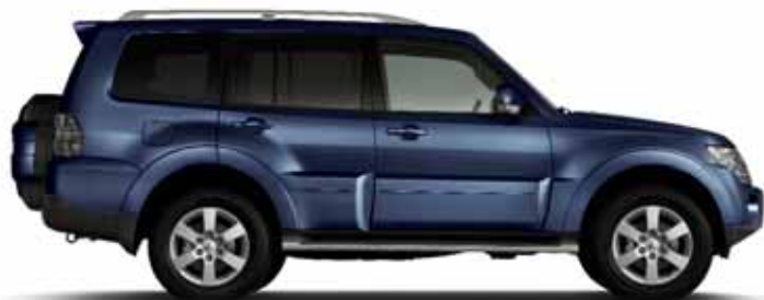
THUNDER BLUE (P)