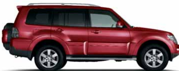
ORIENT RED (M)