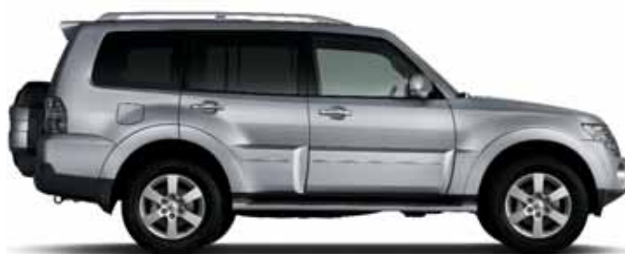
STERLING SILVER (M)