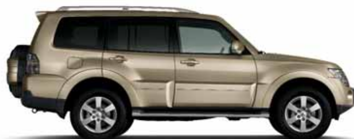
DUNE BEIGE (M)