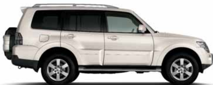
SUMMIT WHITE (S)